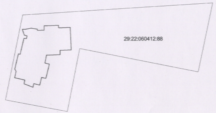
Схема расположения объекта незавершенного строительства на земельном участке